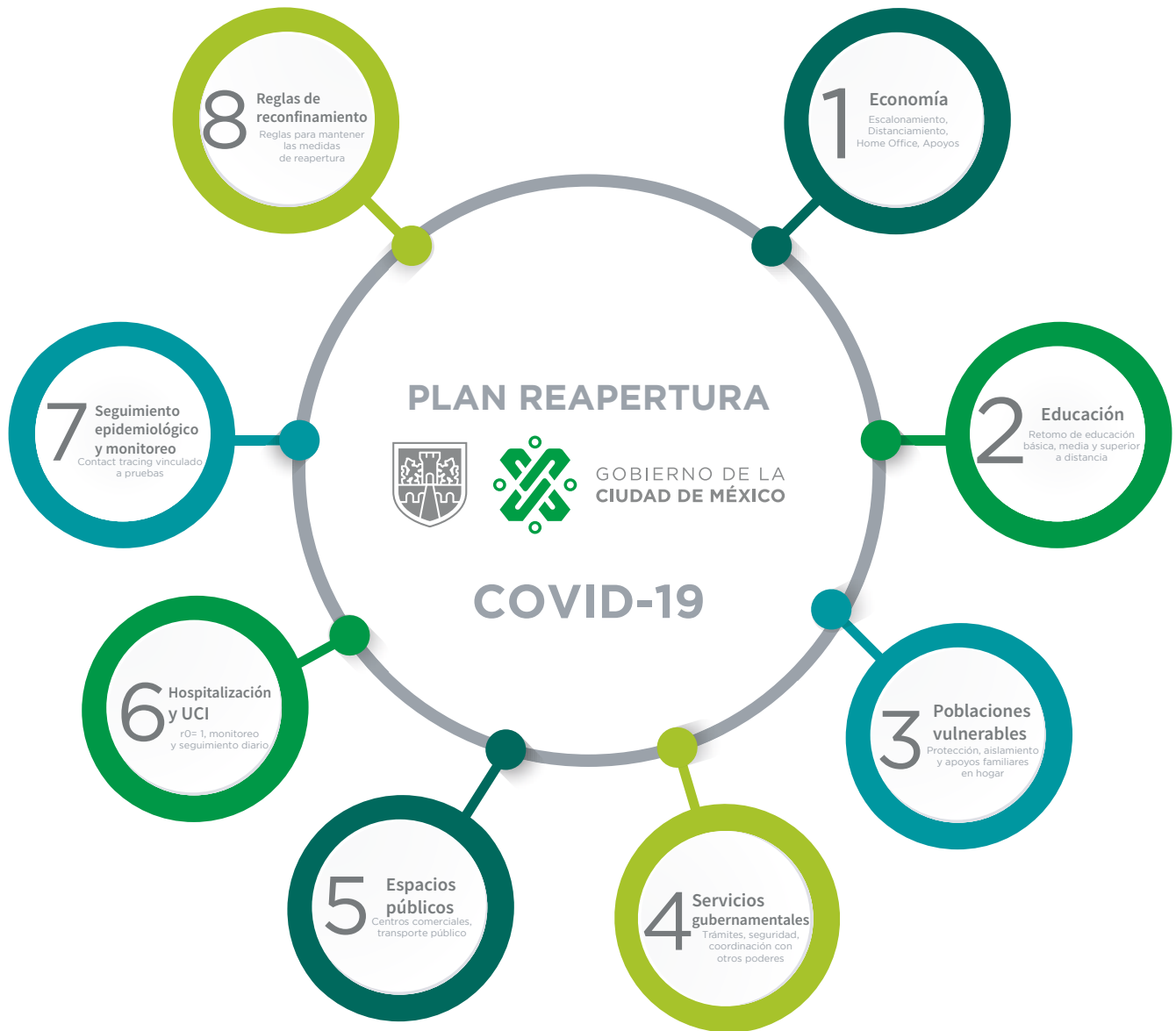
Figura 1. Áreas y Reglas de Relajación del Plan Gradual Hacia la nueva normalidad. Gobierno de la Ciudad de México (2020). Disponible en: Plan Gradual Hacia la nueva normalidad

De manera especial, esta Guía contribuye a las recomendaciones del Plan gradual hacia la nueva normalidad en la Ciudad de México (publicado en mayo de este año), particularmente en lo relativo a las tareas de coordinación y siguientes pasos, en las cuales se propone “la discusión y elaboración conjunta, por medio de videoconferencias, de los protocolos específicos de cada sector (cámaras, comerciantes, agrupaciones, etc.) en coordinación con el Gobierno de México” (Figura 1).