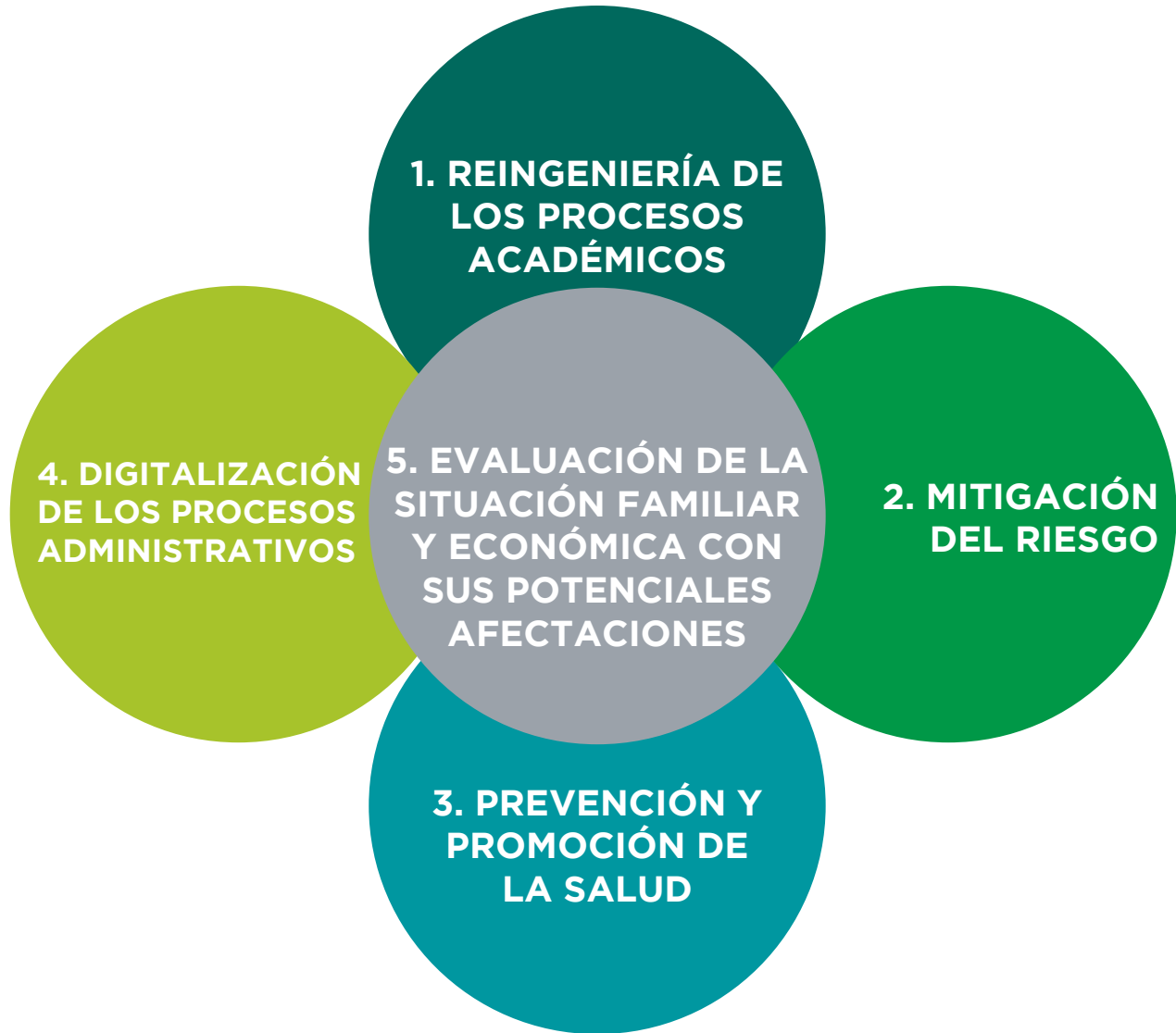
Figura 2. Ejes clave para el retorno saludable a las actividades académicas. Adaptación de IMSS (2020). “Recomendaciones para un retorno saludable al trabajo como parte de la política de apoyo al empleo por COVID-19” Disponible en: http://boletin.canacintraslp.org.mx/Uploads/610_file_1_.pdf (Fecha de consulta: 13 de mayo de 2020)

La presente guía presenta y desarrolla lo que se consideran los ejes clave para lograr exitosamente el retorno saludable a las actividades académicas (Figura 2).